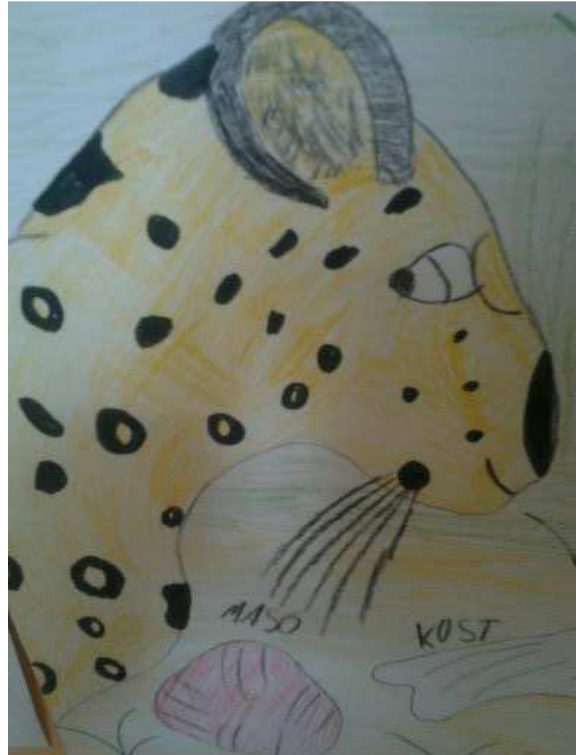
ŠD – Portréty zvířat, jaguár Natálka Z.