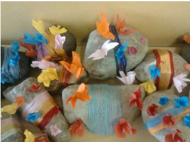
ŠD – rozkvetlá skalka