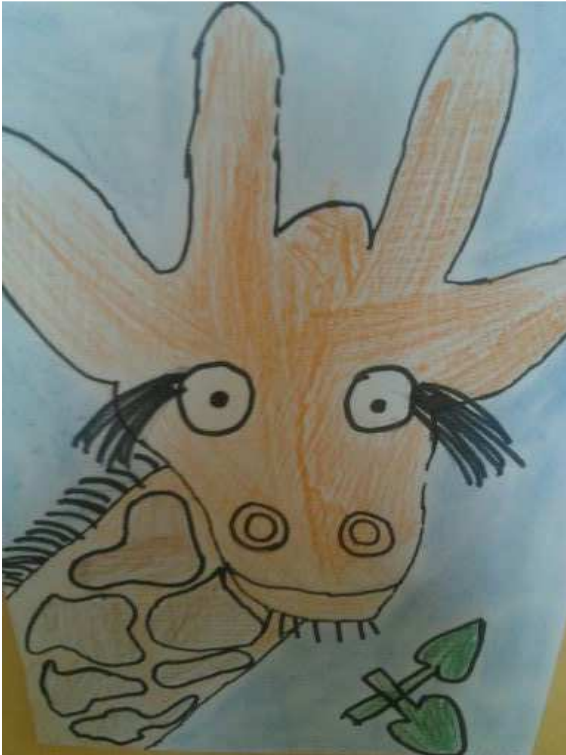
ŠD – Portréty zvířat, žirafa Lenka